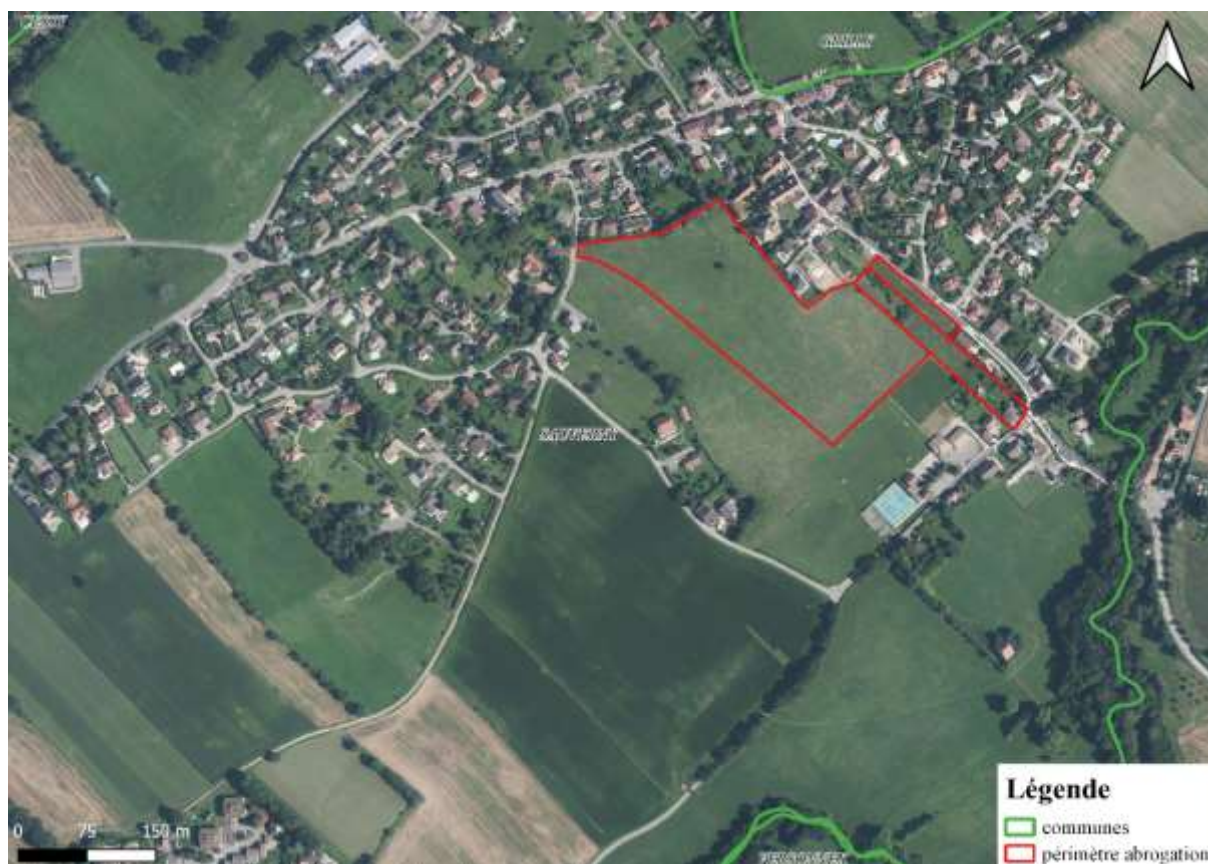
Extrait de plan – localisation des parcelles concernées